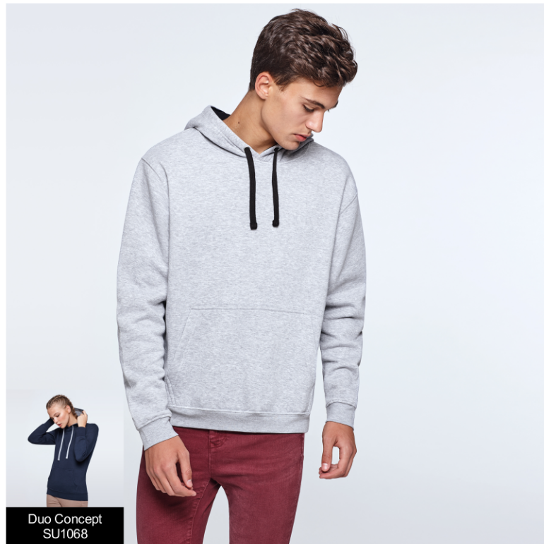
Duo Concept SU1068